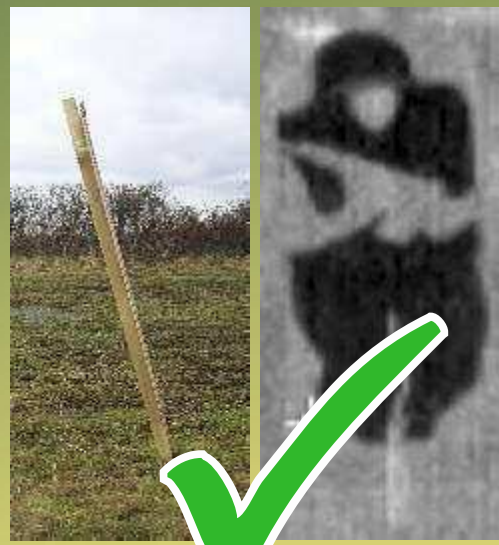
Richtige Installation des Ziels mit entsprechendem Neigungswinkel